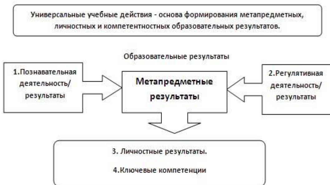
Рис. 2. Система оценки образовательных результатов

Интерпретация результатов оценки ведётся на основе контекстной информации об условиях и особенностях деятельности субъектов образовательного процесса. В частности, итоговая оценка учащихся определяется с учётом их стартового уровня и динамики образовательных достижений.