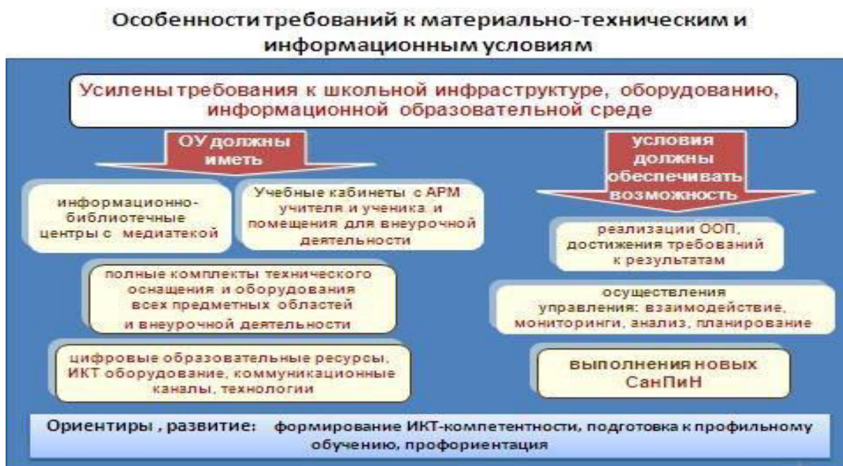
Рис. 2. Особенности требований к материально-техническим и информационным условиям

Материально-техническая база Школы приведена в соответствие с задачами по обеспечению реализации основной образовательной программы, необходимого учебно-материального оснащения образовательной деятельности и созданию соответствующей образовательной и социальной среды.