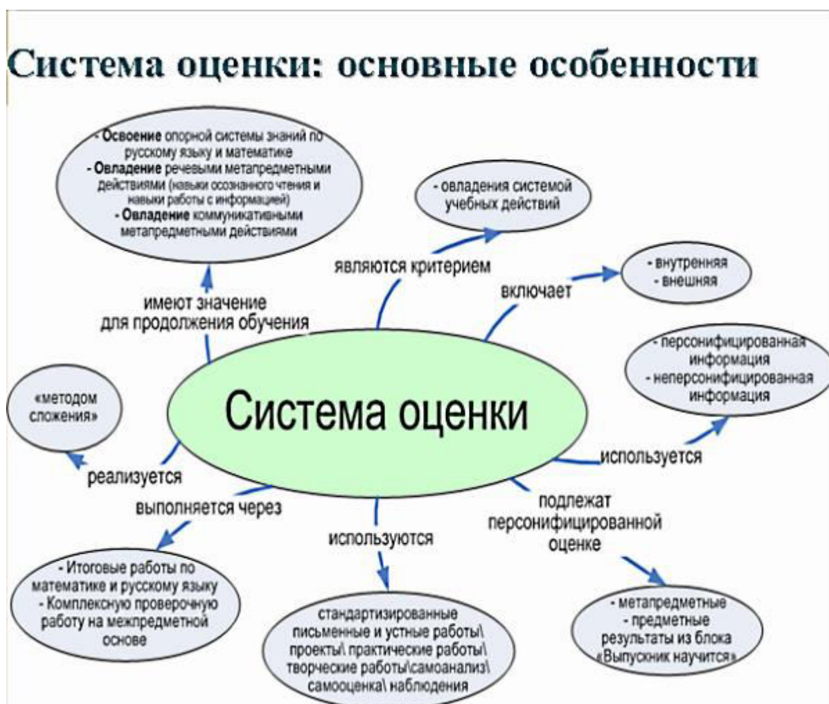
Рис. 1. Система оценки достижения планируемых результатов

Полученные данные используются для оценки состояния и тенденций развития системы образования разного уровня (рис. 1).