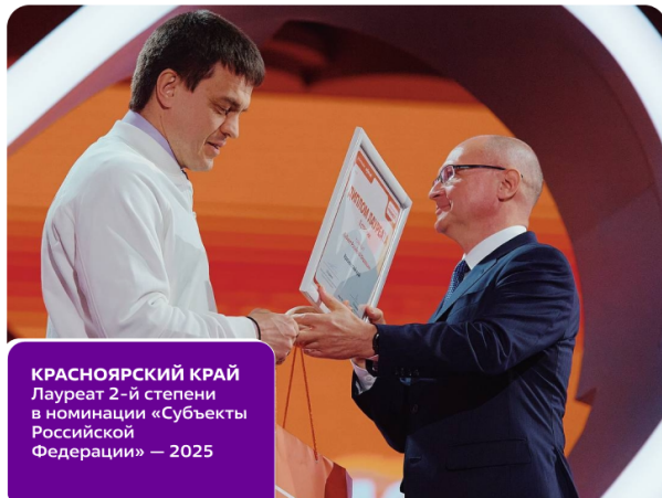
КРАСНОЯРСКИЙ КРАЙ Лауреат 2-й степени в номинации «Субъекты Российской Федерации» — 2025