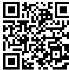
Рисунок 1: QR-код